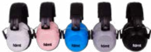
coquilles insonorisantes fdmt réduction sonore efficace pour les hypersensibilités sensorielles

Tous les enfants apprennent différemment et notre but est de les aider à développer leur plein potentiel! Depuis 2002, nous avons à cœur de vous offrir des ressources, des jeux pédagogiques et ludiques, du matériel éducatif innovant et des outils sensoriels de qualité.