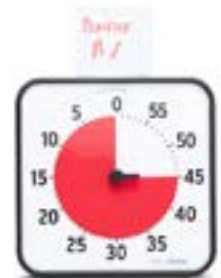
Time Timer Original - moyen outil de représentation visuelle du temps