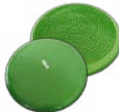
coussin équilibre fdmt assise dynamique et confortable qui favorise l'attention et la concentration